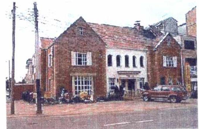
FOTOGRAFIA DEL INMUEBLE :